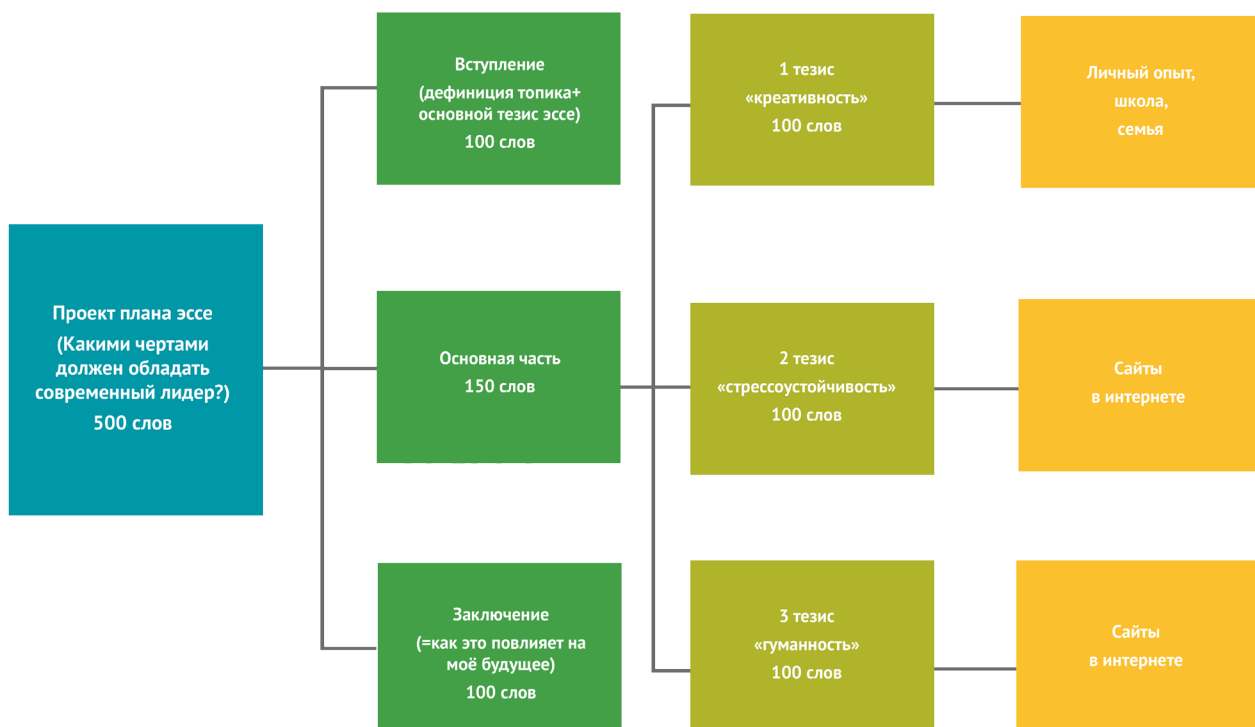
Рис. 2 – Карта-схема эссе на тему: «Какими чертами должен обладать современный лидер?»

Четвертый (4) этап работы связан с формулированием основного тезиса эссе : об этом вопросе мы подробнее остановимся в следующем уроке.