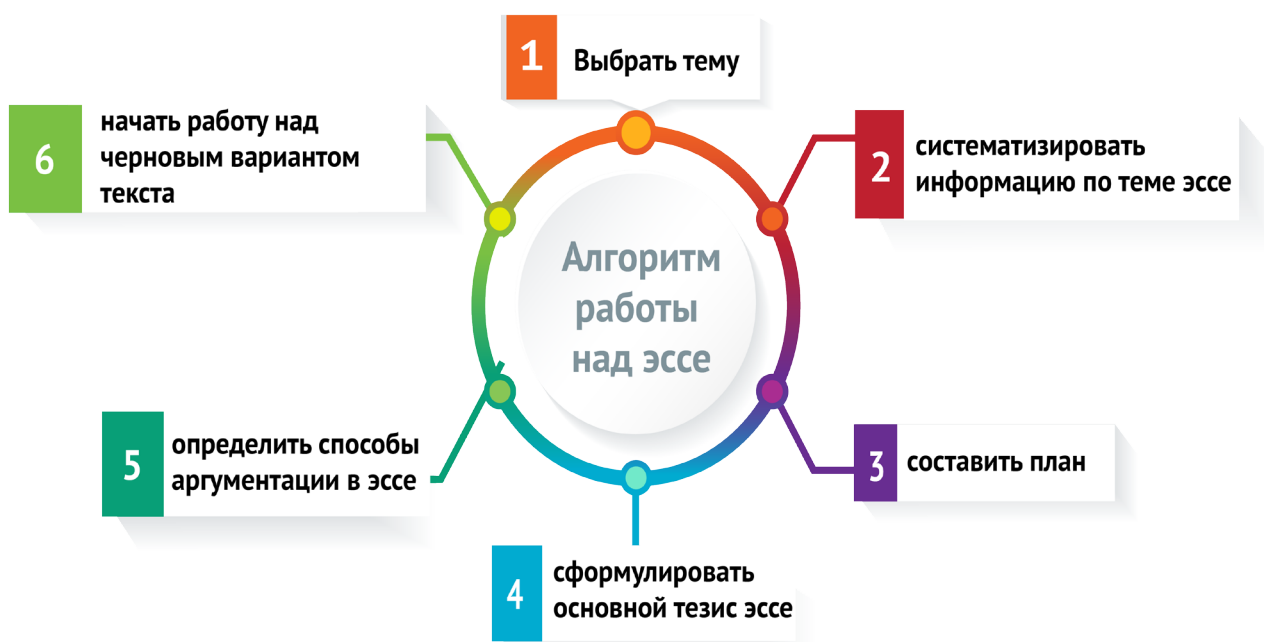
Рис.1 – Алгоритм работы над эссе

Итак, после того, как мы определились в первой части урока с тем, что представляет собой аргументативное эссе, я перейду к вопросу о том, как приступить к работе над эссе. Начнем с того, что процесс написания эссе имеет определенный алгоритм (набор инструкций, описывающих порядок действий исполнителя для достижения некоторого результата) (см. Рис. 1):